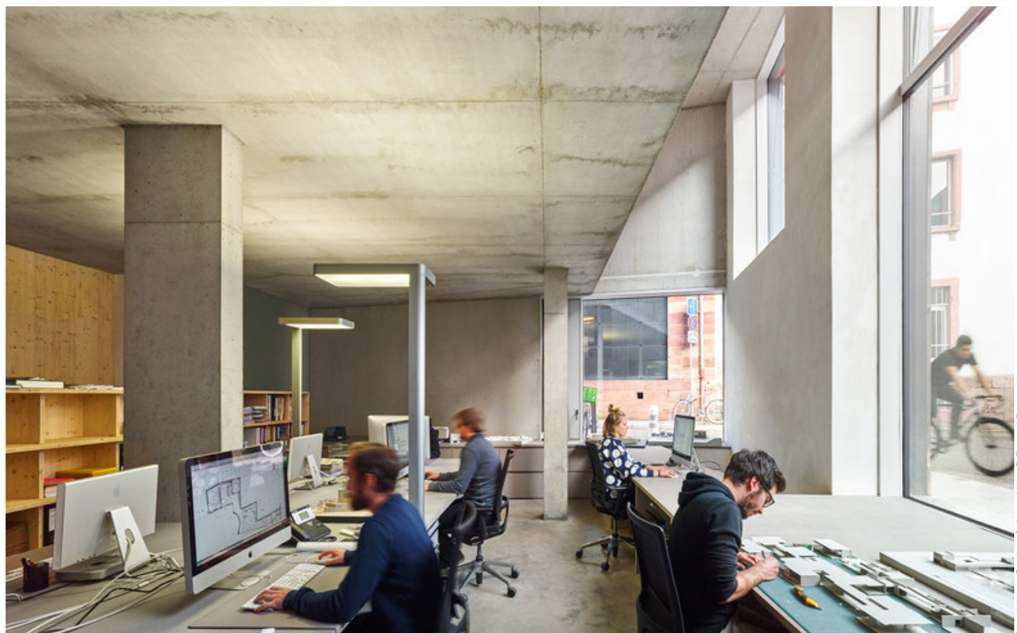
Dominique Coulton & Associés

L'Ordre des Architectes Auvergne-Rhône-Alpes a réalisé une enquête pour connaître l'état de santé de la profession face au contexte actuel de crise des matériaux.